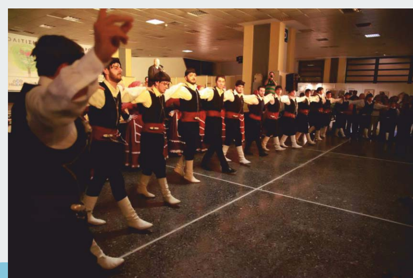
Τμήματα Παραδοσιακών και Κρητικών Χορών Κέντρου Τέχνης & Πολιτισμού Δήμου Αμαρουσίου