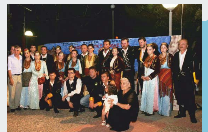
Χορευτικό Συγκρότημα Συλλόγου Ποντίων Αμαρουσίου «Νίκος Καπετανίδης»