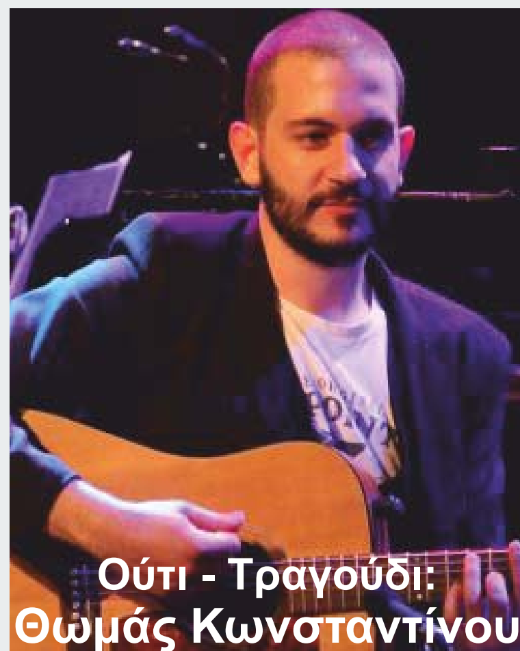
Ούτι - Τραγούδι: Θωμάς Κωνσταντίνου