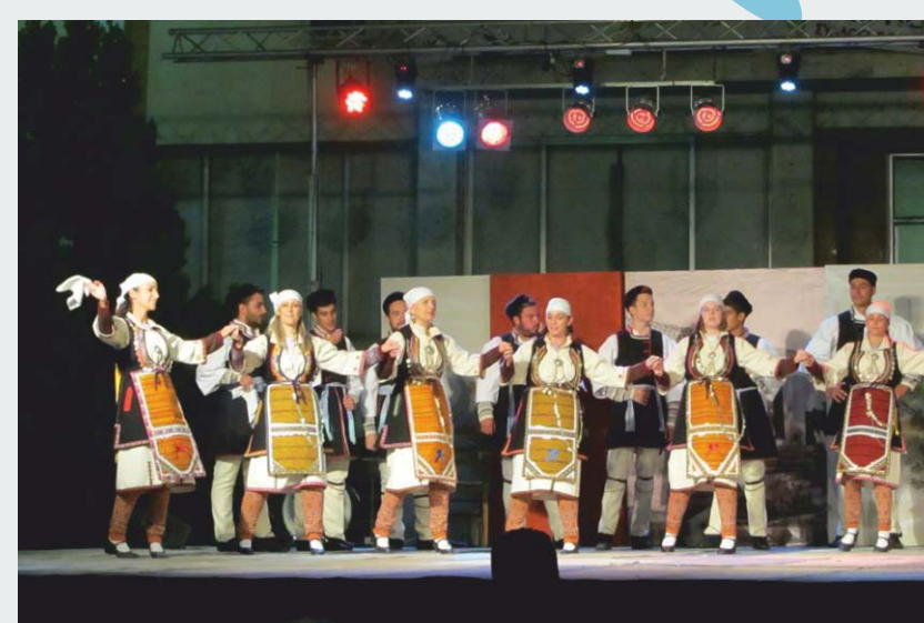
Τμήμα Παραδοσιακών Χορών Δήμου Ασπροπύργου συνοδεία της ορχήστρας «ΘΡΙΑ»