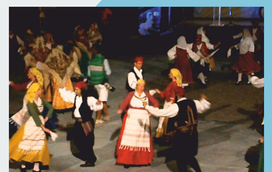
Χορευτικό Ιδρύματος «Π. ΖΗΣΗ» Δήμου Χαλανδρίου

Η εκδήλωση πραγματοποιείται με χορηγίες τοπικών επιχειρήσεων