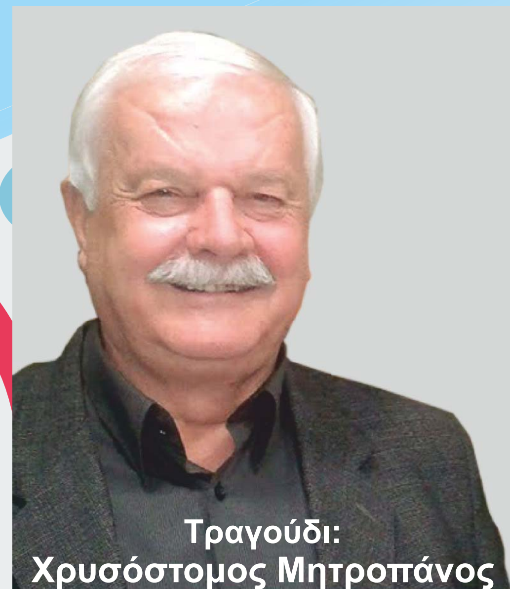
Τραγούδι: Χρυσόστομος Μητροπάνος